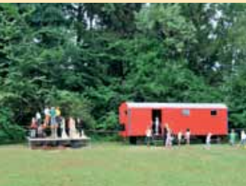
Das Tagungshaus liegt inmitten einer weitläufigen Anlage mit wunderschönen Kastanienbäumen

Wer sich unserem Tagungshaus nähert sieht schon von weitem wie viel Raum und sattes Grün es umgibt. Auf einer Fläche von vier Hektar liegt das Gebäude, in dem das Jugend- und Tagungshaus untergebracht ist.